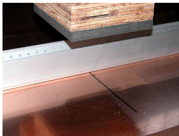
Fig. 1: verifica visiva con dima.

L'entità delle deformazioni permanenti all'estradosso è risultata praticamente trascurabile (deformazione permanente massima registrata pari a 5/10 mm). Pertanto la funzionalità e la sicurezza del campione di copertura non sono state minimamente compromesse.